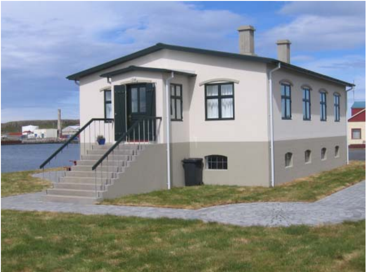
Bjarmanes á Skagaströnd 1913 (JN)