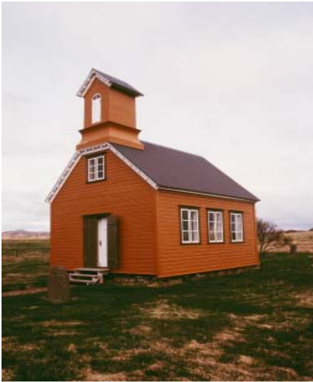
Hjarðarholtskirkja í Stafholtstungum 1895 (MS)