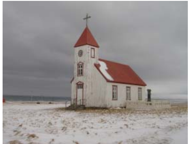
Sauðaneskirkja á Langanesi 1882 (MS)

Húsafríðunarnefnd hélt 8 fundi á árinu og fjallaði þar um áætlanir vegna framkvæmda við friðuð hús og önnur hús, sem hafa listrænt og menningarsögulegt gildi. Þá fjallaði hún og um innra starf nefndarinnar, útgáfustarfsemi og styrkveitingar í húsafríðunarsjóð. Nefndin hélt uppteknum hætti og fór í árlega eftirlitsferð um landið, að þessu sinni um austanverða Vestfirði og Norðurland vestra.