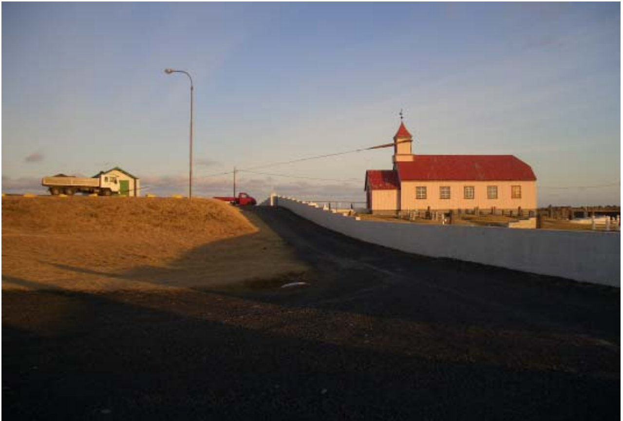
Ein af viðgerðaraðferðum Húsafriðunarnefndar. Turn réttur af. Útskálakirkja 1879 (MS)