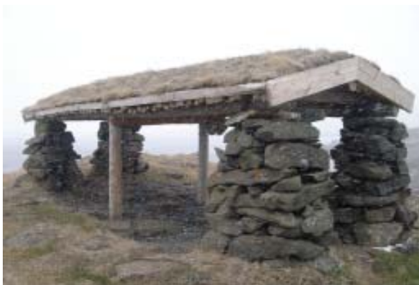
Nýviðgerður hákarlahjallur í Hamarsbæli á Selströnd