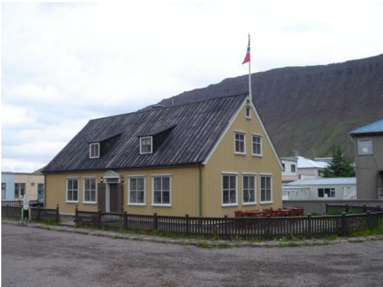
Hæstakaupstaðarhúsið á Ísafirði 1788 (MS)