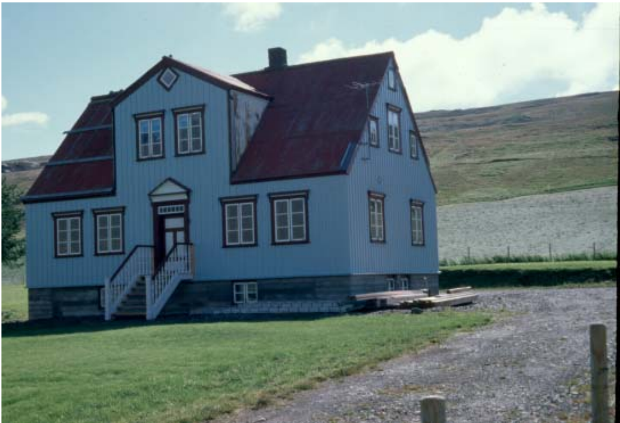
Gamlt sýslumannshúsið að Kornsó í Vatnsdal 1879 (MS)