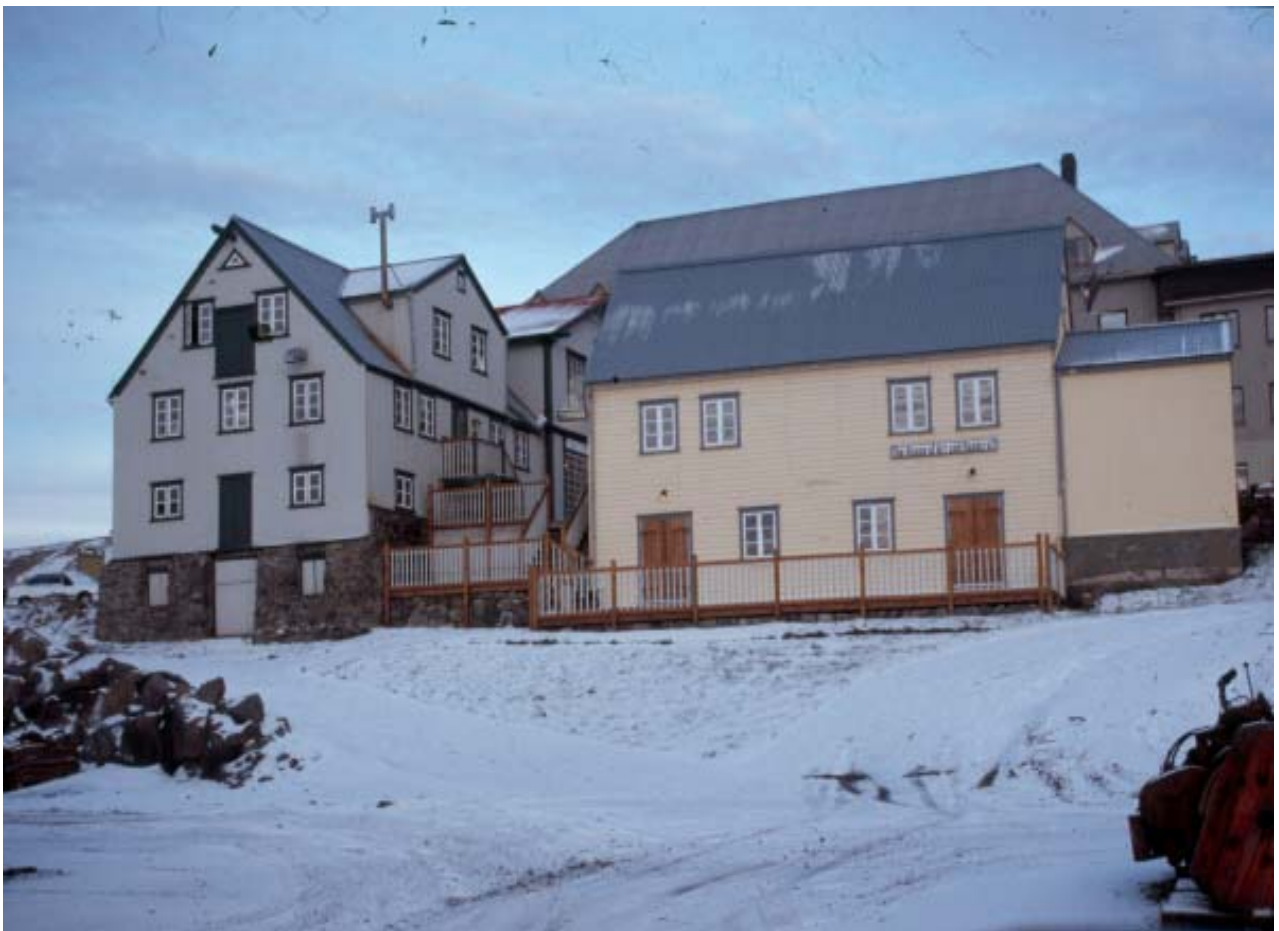
Elstu verslunarahús K.Þ. á Húsavík. 1883,1886,1902 (MS)