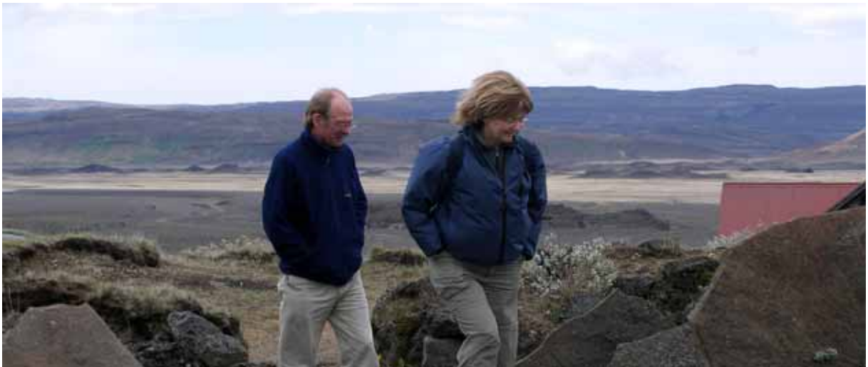
Við Stöng í Þjórsárdal