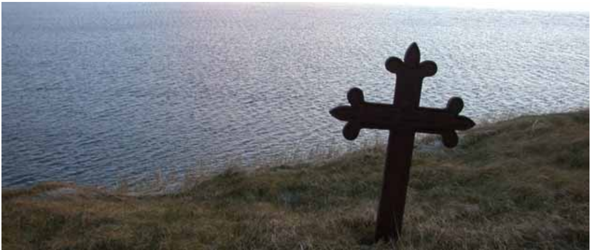
Minningarmörk á Álftanesi