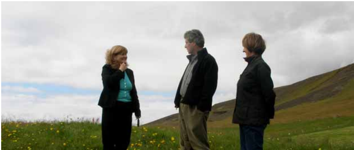
Við Hrísbú í Mosfellsdal