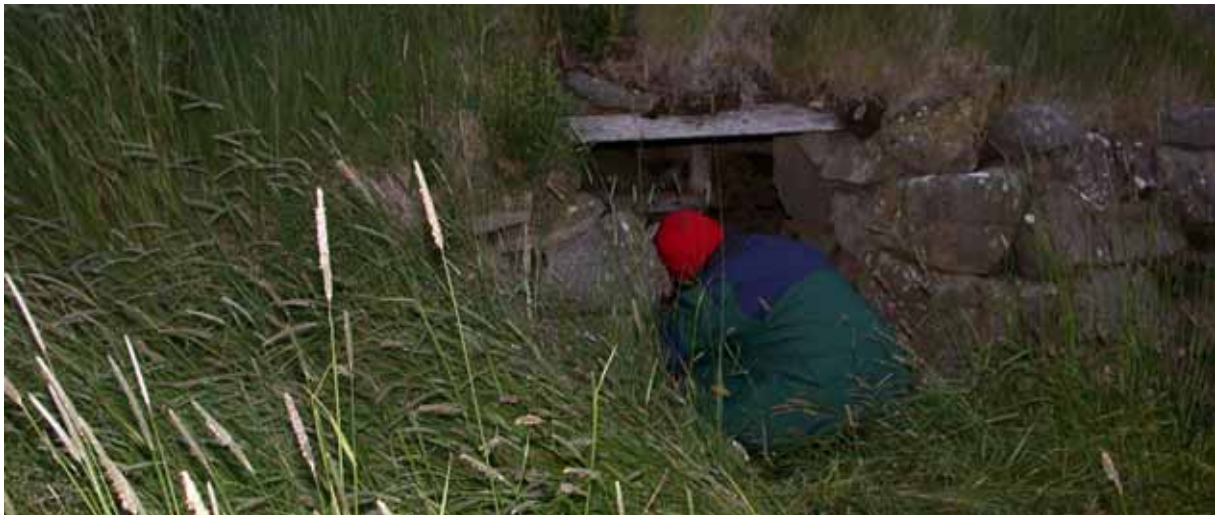
Á ferðalagi um Vestfirði