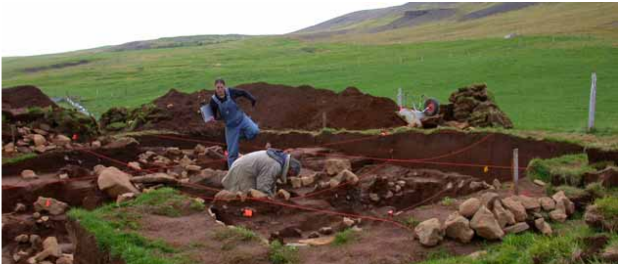
Uppgröftur við Hrísbú