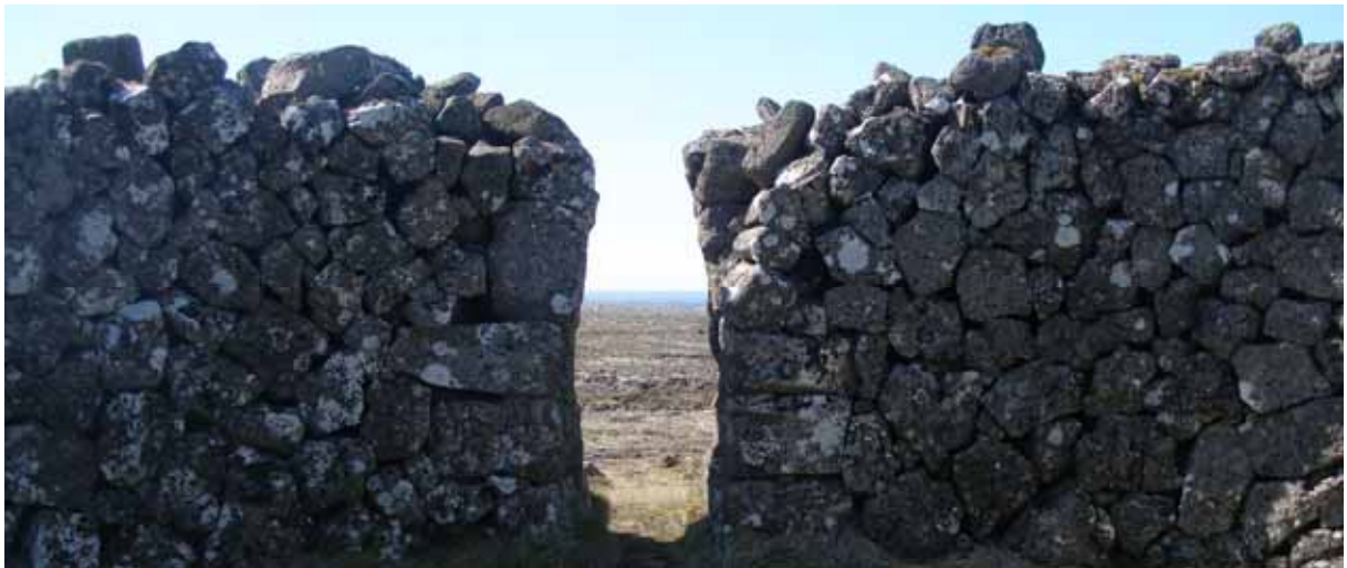
Staðarborg á Vatnsleysuströnd