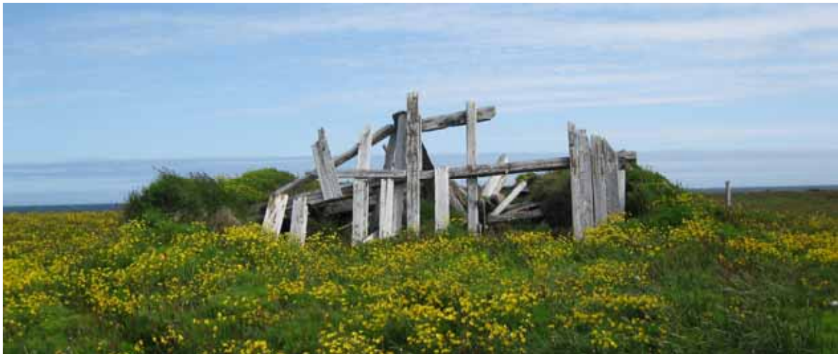
Fjánhús á Siglunesi