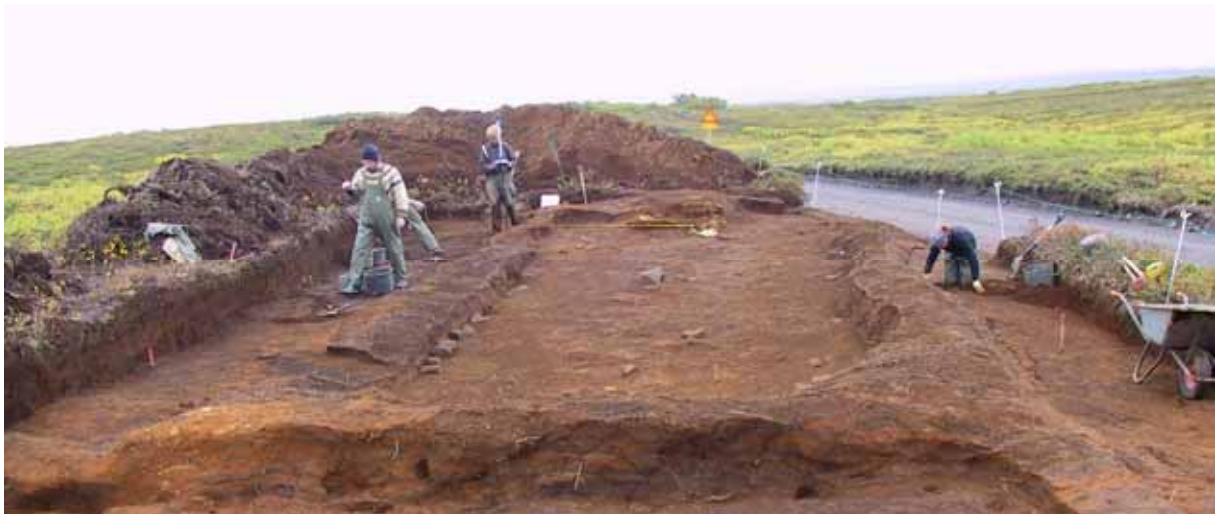
Uppgröftur við Maríugerði í Kelduhverfi