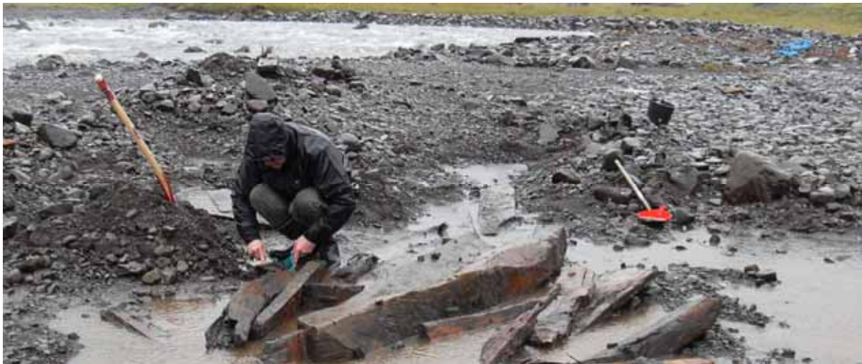
Skipsflak við Seyðisfjörð