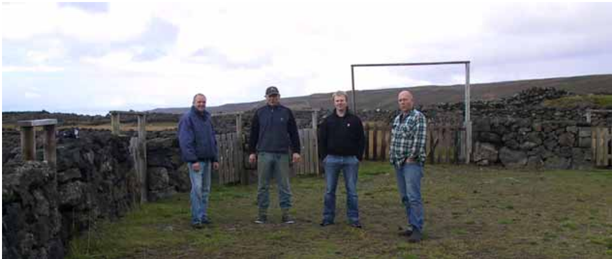
Við Hraunsrétt í Aðaldal