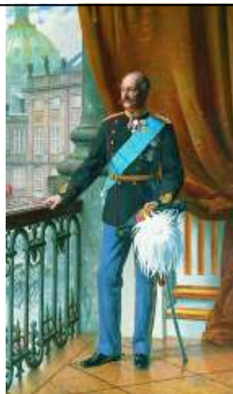
Friðrik 8 (1843-1912)

Fyrstu íslensku lögin um minjavernd, lög nr. 40/1907 undirrituð af Friðrik 8