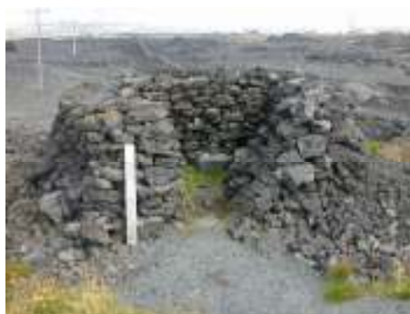
Kapellan í Kapelluhrauni við Straumsvík, án tengsla við umhverfið