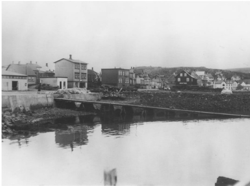
Strandgata um 1920

af svokölluðum timburbæjum, bárujárnsklæddum en það sem einkenndi þá voru að veggir þeirra voru það lágir að einungis voru gluggar á göflunum.