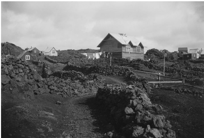
Miðsund um 1907

Segja má að þegar Hafnarfjörður fékk kaupstaðarréttindi árið 1908 hafi ekki verið nokkurt skipulag á byggðinni og fáar eiginlegar götur í bænum. Strandgatan og Reykjavíkurvegurinn voru þó á sínum stað en að öðru leyti má segja að einungis hafi verið um slóða og stíga að ræða. Þar sem bæjarfélagið var fámennt og bæjarsjóður ekki vaxinn til stórframkvæmda var ljóst að kostnaðarsamar framkvæmdir eins og gatnagerð var, sérstaklega í svo erfiðu landslagi, yrðu ekki forgangsverkefni. Árið 1911 var sett á fót nefnd sem fékk það hlutverk að gefa götum og slóðum í Hafnarfirði nöfn og tölusetja