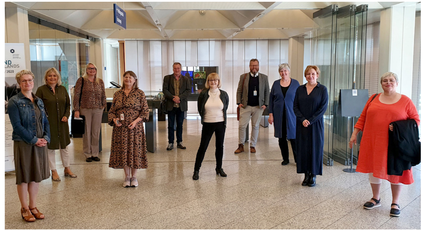
Stýrihópur stefnumótunar um menningararfinn