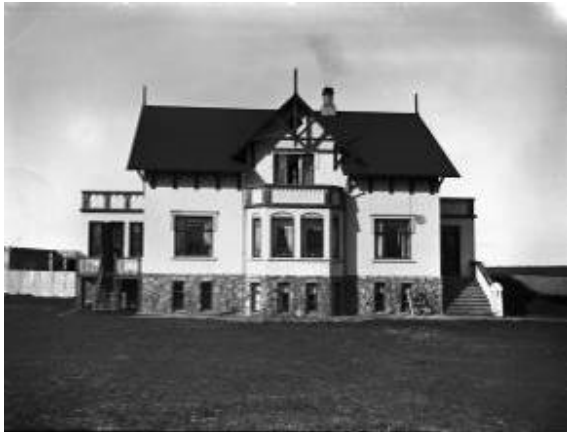
Suðurgata 39, líklega fyrir 1936.