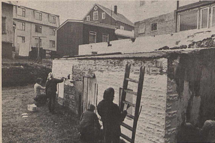
Íbúar Grjótagarps máluðu skúrinn á sínum tíma og gerðu hinn snyrtilegasta garð fyrir framan hann.

hefur verið breytt til þess að stuðla að þessu. Til þess að varðveita heil hverfi héraendis þarf bæði skilning eigenda og almennings. Þá þarf hið opinbera að beita skipulagslögum til þess að stuðla að húsvernd og gera mönnum fjárhagslega kleift að endurbæta gömul hús og búa í þeim.