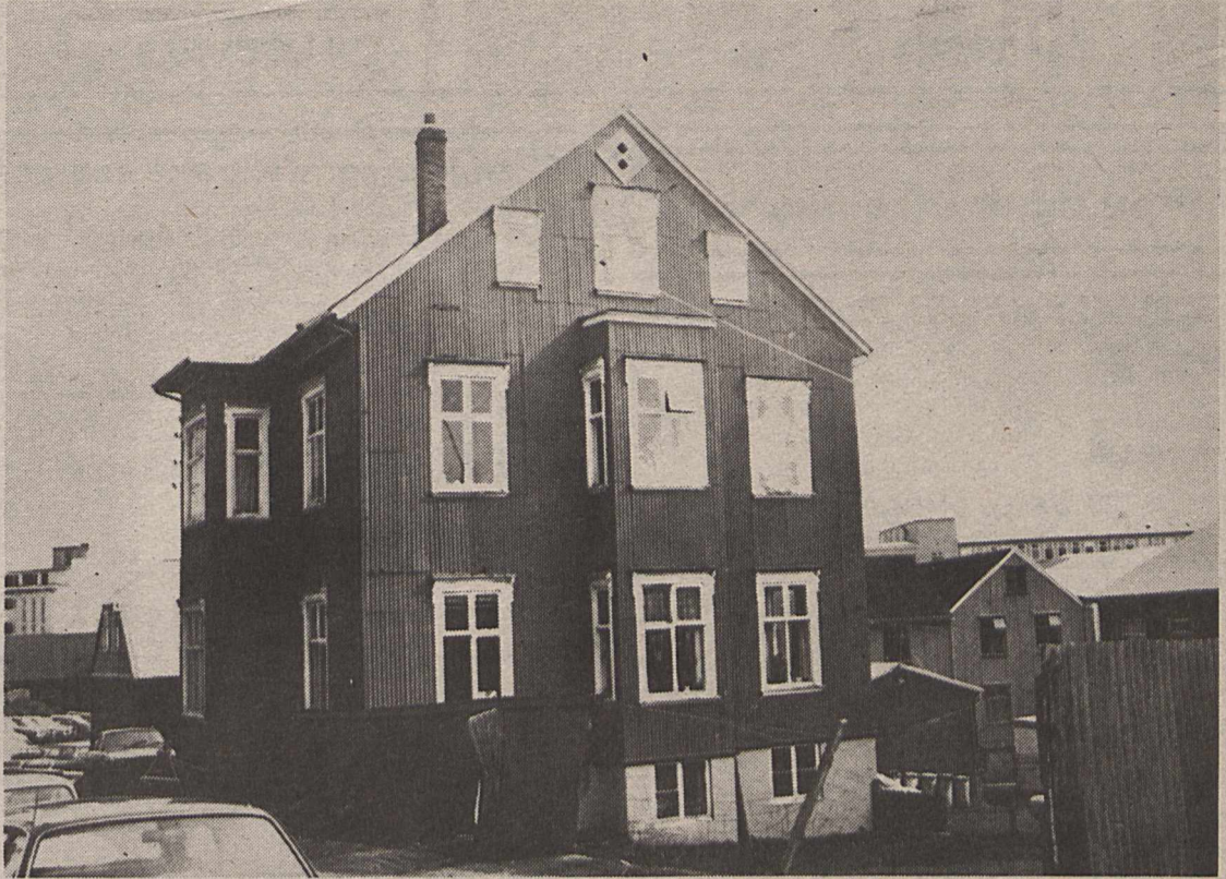
Mjóstræti 3, Vinaminni, sem reist var árið 1885.