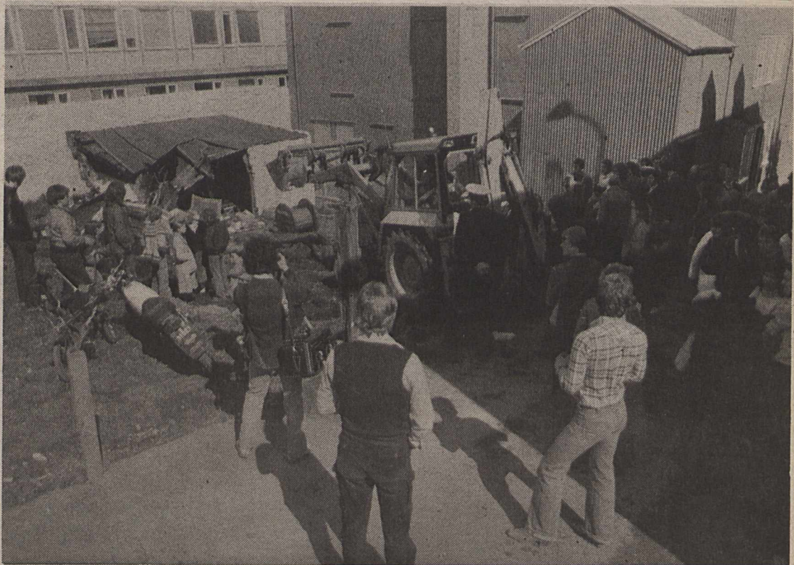
Vinnuvélin sem braut niður skúrbygginguna og rótaði upp jarðvegnum á dögnum. Eigandi lóðarinnar hefur nú skipt um skoðun og mun fús að tyrfa í sárin og setja niður blóm og fleira í garðinn.