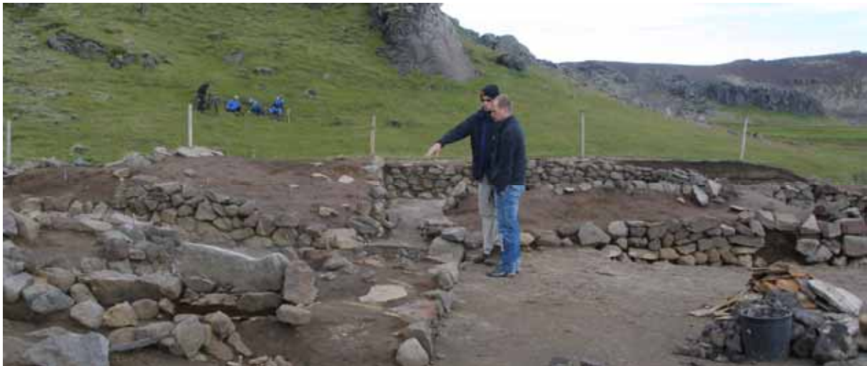
Uppgröftur við Salthöfða