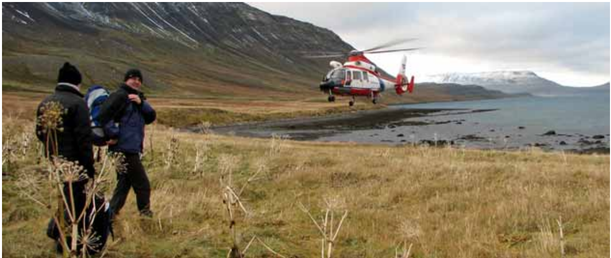
Hrafnfjörður við Jökulfirði