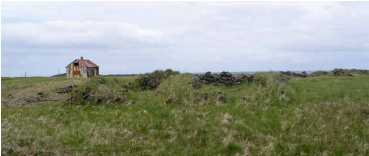
Óttarsstaðir í Hafnarfirði