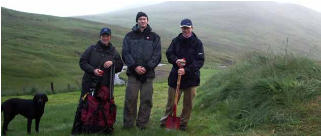
Í ferð um Laxárdal með starfsmönnum NNV