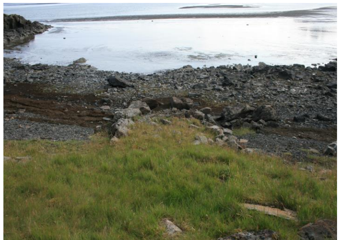
Mynd 11- horft í suður

Um 70 metra vestur af uppsátri [010] er hin svokallaða Skítavík og er mynni hennar um 23 metrar að lengd og um 17 metrar að dýpt. Í botni hennar fyrir miðju er Bryggjan [101674:011] Eru ummerki um hana ágætlega sýnileg. Um er að ræða nokkurskonar tungu sem er hlaðin niður af grasbakkanum og út í fjöruborð vökurinnar. Bryggjan er grjóthlaðin. Lengd um 5 metrar og breidd 2 metrar.