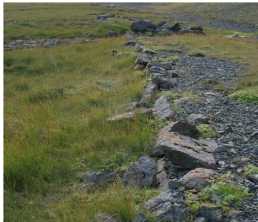
Mynd 1- horft í vestur

Austast er Gamlivegurinn [001] frá Þorgeirsstöðum og að Klifunum. Hann liggur í austur-vestur fyrir neðan nýja veginn tæpa 200 metra norður af ströndinni. Upphaflegi vegurinn hefur verið lengri en sést í dag en vegna framkvæmda í nútíma hefur bæði austasti og vestasti hluti hans verið ruddur burt. Upphaflega hefur vegurinn eflaust verið markaður með grjótkæðu að sunnan- og norðanverð. Sjást þær enn á stöku stað en þó aðallega að sunnaverðu, eins og sést á myndinni að ofan (mynd 1). Vegurinn hefur eflaust átt sér undanfara af vögnum áður en bílar taka við.