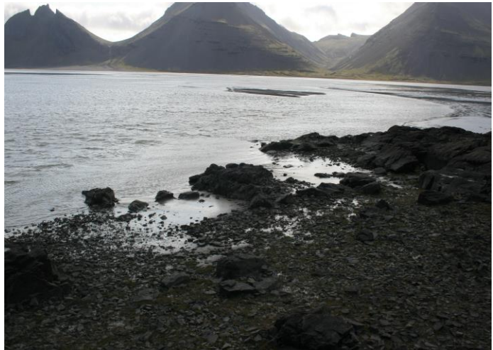
Mynd 10- horft í suðvestur

Um 8 metra, suðvestan við naust [009] er önnur vík sem rutt hefur verið að hluta (sjá mynd 10). Hefur víkin líkt og aðrar við Klifarnar verið nýtt sem uppsátur [010].