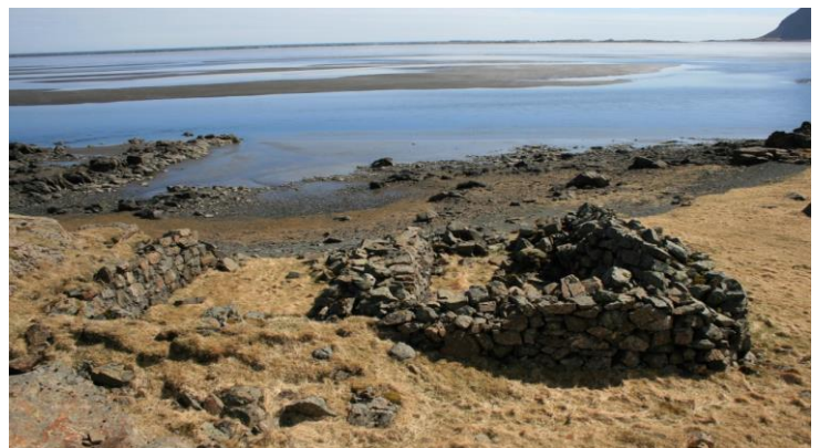
Mynd 3- horft í suður