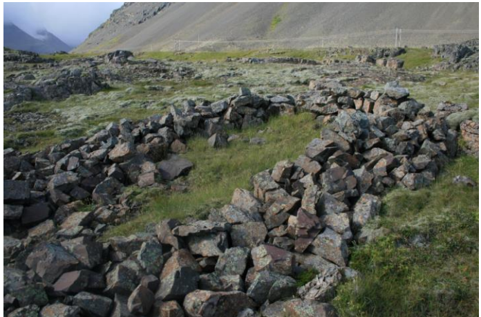
Mynd 14- horft í norðvestur

Um 45 metra vestur af Skítavík og um 6 metra beint upp af fjöruborðinu er vestasta naustið í Klifunum [101674:014]. Er það sagt hafa tekið einn stóran bát (sjá mynd 14). Þetta naust áttu þeir Guðjón frá Þorgeirsstöðum og Einar frá Efri-Firði. Veggirnir hafa hrunið þó nokkuð en grunnurinn er breiður og stöðugur. Vegghæð er frá 0.4 til 0.70m. Veggjabreidd mest um 2.0m. Naustið er opið að sunnanverðu og horfir suður til hafs líkt og venja er.