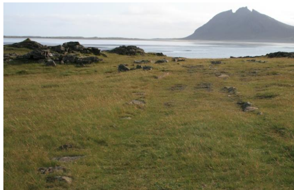
Mynd 5- horft í suður

Fyrir ofan Húsið [003] liggur leið að svæðinu. Er hún lögð með steinakeðju sitthvoru megin slóðans og er 46 metra löng og um 3-,3,5 metri að breidd. Leiðin liggur í norður-suður í átt að sjónum en hefur verið rofin að norðanverðu af mannavöldum á einhverjum tímapunkti.