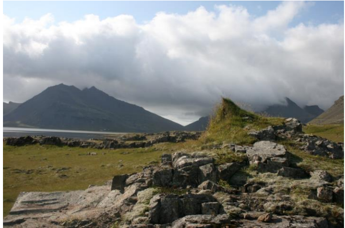
Mynd 18- horft í vestur

Beint fyrir ofan Húsið [003], í beinni sjónlínu frá fjöruborði og að Þorgeirsstaðatindi er Þúfan sem markar landamerkin á milli Þorgeirsstaða og Efri-Fjarðar. Er þetta hundapúfa sem myndast hefur á hæsta klettinum undir Þorgeirsstaðatindi og því ágætis landamerki. Er hún grasivaxin um 0.4m á hæð og 0.5m í ummál.