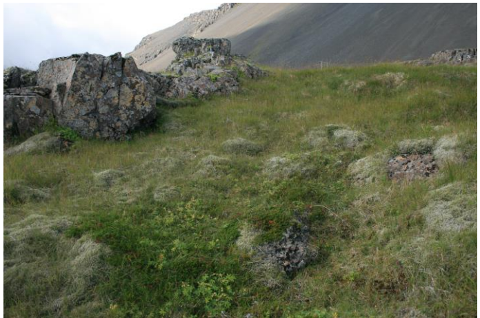
Mynd 13- horft í norður

Auðkennisnúmer: ASKAFT-101674:013 Sérheiti: - Tegund: tóft Tegund annað: - Hlutverk: naust Aldur frá: - Aldur til: 1950 Friðlýst: nei Ástand: illgreinilegt Hætta: hætta Vegghæð frá: 0,2 Vegghæð til: 0.4 Breidd: 0.80