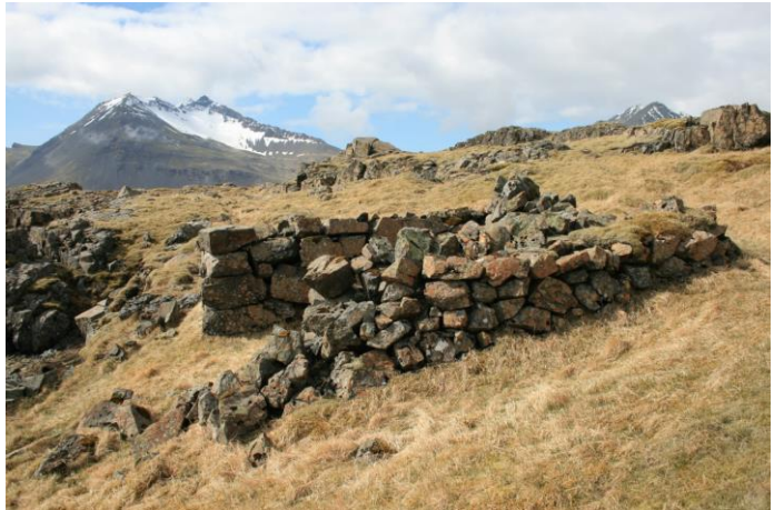
Myndi 12- horft í vestur

Auðkennisnúmer: ASKAFT-101674:012 Sérheiti: Sjóhúsið Tegund: tóft Tegund annað: - Hlutverk: Fiskhús Aldur frá: 1890 Aldur til: 1950 Friðlýst: nei Ástand: vel greinilegt Hætta: hætta Vegghæð frá: 1.2 Vegghæð til: 1.7 Breidd: 2m