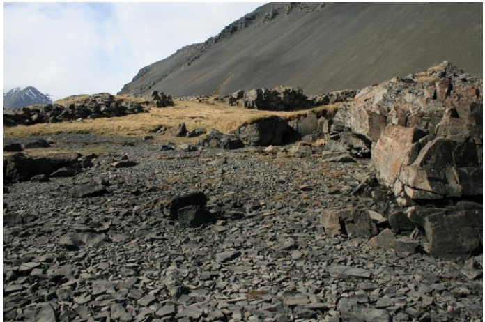
Mynd 17- horft í norðvestur

Um 20 metra beint vestur af uppsátri [016] er enn önnur vík sem rutt hefur verið að hluta og nýtt sem uppsátur [101674:016]. Þessi vík er þó töluvert breiðari en aðrar sem nýttar hafa verið til uppsáturs. Sjást ummerki um rutt svæði austast í víkinni. Svæðið sem rutt hefur verið til uppsáturs er um 10 metrar á dýpt en um 5 metrar á breidd. Víkin sjálf eru um 50 m á breidd.