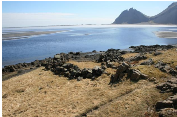
Mynd 9- horft í suður

Rétt ofan og vestan við uppsátur [008] er naust [101674:009]. Var það sagt tveggja báta (sjá mynd 8). Liggur það um 4 metra frá fjöruborðinu og er opið til suðurs líkt og venja er. Veggirnir hafa hrunið nokkuð en eru þó vel greinilegir. Vegghæð er um 0.90 til 1.20m að hæð en veggjabreidd breiðust um 1,5 metri.