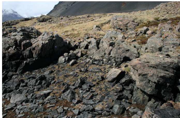
Mynd 15- horft í norður

Um 3 metra beint suður af nausti [014] er vík sem rutt hefur verið að hluta og nýtt sem uppsátur [101674:015].