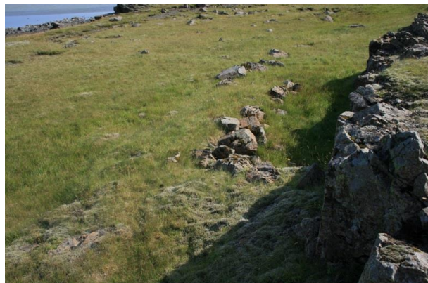
Mynd 7- horft í suðvestur