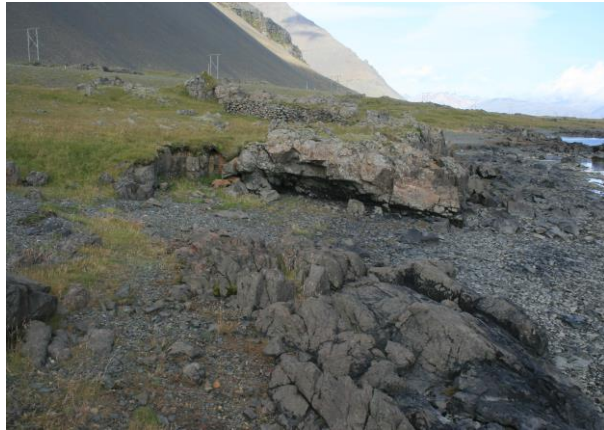
Mynd 8- horft í austur

Beint suður af nausti [007] er náttúruleg vík sem rutt hefur verið að hluta og nýtt sem uppsátur [101674:008] (sjá kort 1 og mynd 8).