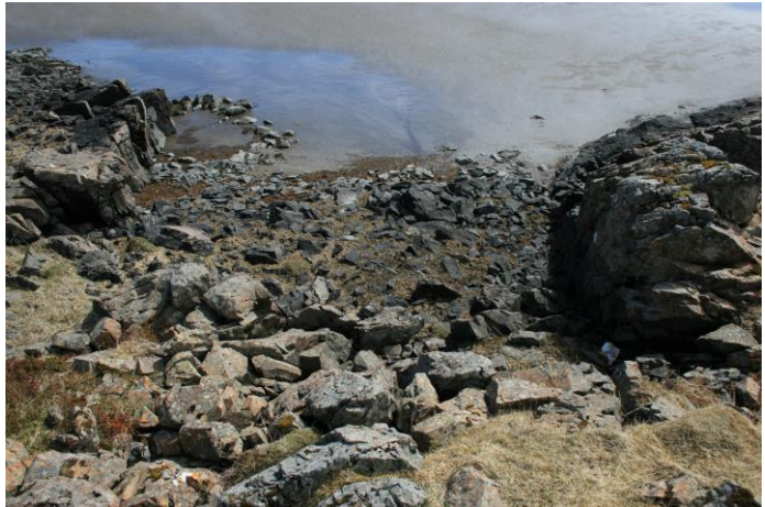
Mynd 16- horft í suður

Um 30 metra beint vestur af uppsátri [015] er enn önnur vík sem rutt hefur verið að hluta og nýtt sem uppsátur [101674:016].