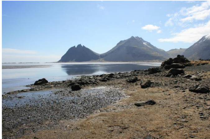
Mynd 4- horft í suðvestur

Beint undir Naustinu [002] er vík. Þessi vík er náttúruleg en hefur verið rutt að einhverju leiti. Hefur hún þjónað sem uppsátur og eru greinileg merki um hleðslur fremst í víkinni þar sem bátar hafa verið skorðaðir af eða festir.