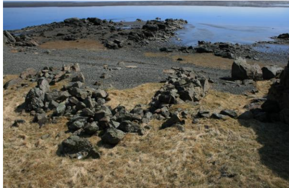
Mynd 2- horft í suður

Austast í klifunum er Naustið [101674:002](sjá mynd 2). Naustið eru þrjú samföst naust rétt við fjöruborðið. Tilheyrði Naustið skv. Signýju Guðmundsdóttur bændum á Bæ, Krossalandi og Volaseli (sjá að ofan lýsingu Signýjar). Tóftin stendur um 5 metra frá fjöruborðinu, er samtals 11 metrar frá austri til vesturs og um 9 metrar frá suðri til norðurs. Veggirnir hafa hrunið að mestu en grunnurinn stendur enn. Naustin eru opin að sunnanverðu og horfa til hafs líkt og venja er.